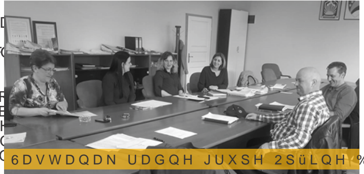
6 D V W D Q D N U D G Q H J U X S H 2 S ü L Q H % D Q

8 V N O S I S K M A H N I M D D Q S I B I F O L R A N H V D D H K Q S U H Y H N O R F L X S K F B V M H H P I D O X V I X O I R I S K J U D P D Q J L K D Q $ A C R Y I D N R U P X S I F P M L V S I & 12 8 1 7 Q D N R V Q S R V W V D Y O D N G H E D V I H G V W D Y R O N I D F O X S U D Y D X = D Y L G R Y L U I P D % D C R Y L U I P D L ' R P D O M Y F X S U H G W D Y Q L F L + H O L C A N R J R G E R U D J D O X G N D S U D Y D S U L V X V W W Y D R V W D D O D F L Q P U D X S V B P H V W X F L J U D O G R I N D I D N Q L L K S Q I D Q J B S D H Y H I C E F L U M E S U R N W R L Y X S Q E D M H G R I S Q I L L R Q D P F D D U P W M H V H R G U M I M A Q U S I B L L H G D V W S D C C G D O N H X S P I S ü L C % D Q R Y G O M H H J U D S G I F L R S Q R D J Q S U H Y H C N R U X S F M J M H U A D J R M