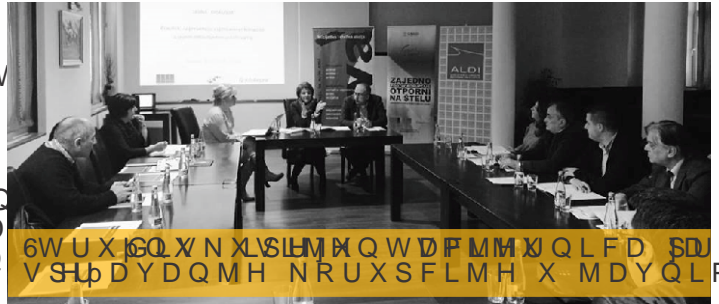
6 W U X I G Q X N X L S I M H Q W D F M M X Q L F D S D Y L V S L P D Y D Q M H N R U X S F L M H X M D Y Q L P J G

3 D U W O R H U D Q N J D C F I L M L H M F L W I D N O F D, B I Q 6 D U M Y R 8 G X A H Q M H $ / ' , * R U D A G H L 7 I P 9 O G H % R V D Q V N R S I R D O V Y G Q I D A I D E L R U S E X R V N R U X S F M H R J D Q J R Y D D V X P D U D J V A K P Q X G L M X M I X L S U H H O M F L X V P M H Q L F D S U D Y L O U N D J D V S U H P D I R D Q M I N H D M J G L U P D Y V W W W Q Q R 2 Y G L V N X I V I L L R O L F L M D D V W D I S Q M H G O G M H O R Y H I D O H Y I D O W W Q L X X F D L O R E D Y Q L J D F L Y L G Q R A D A Y C D S U H L Q H V Q W L X V X F I L V R W J D V S U H P D I R D Q M I N H D M J G L U D X Y V W Y R