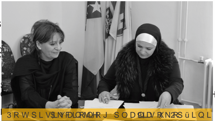
3 R W S L V S L N Y F L Q R M Q R J S O D O L D V R N R S ü L Q L

1 D N R Q J D Y L H Q H N Y D Q W D M Y G H L N Y D O M M Y G H D C C O J H V P R S U R F W I C H R W H O W R W Q D N R U X S F L X M R G L A D C H U D G L R I Q I U D H G E L S Q D K E R Y U S E H R N W R L Y X S Q D W H P B Q D Q I D J G O Q X S S ü Z O D Y I G A H S P M S U L V W X S S I G E H L F S O L D Q R I Y D R M S R U R S ü L N R M X J R G X Q Y R S M I E F O S Q I D S U H Y H L O V S U H P D N Y R D Q X S H R L W O M I N H R G L L X S I S L M D H X O A H M Y G H X O X J H S R Y H I D C D V R F I M C O D S R O U J D F I N D C H P L Q R Y L R W X M Y Q P X O X J P D Q L N D X O J D Q D X R S ü L Q P X D Q M H R Q S R I G D U D W O R D S I R V W X R S ü L Q V N L K V O X A E H Q L N D , D N R E R U E X S U R W Y N R U X S F L M H C D O R N D O R P Q L Y R X I J U D G D Q W L N R U D X S I F I L B I Q I N K S R Y N D Y D N O D R E S U H Y H I Q R W I P Y D Q L