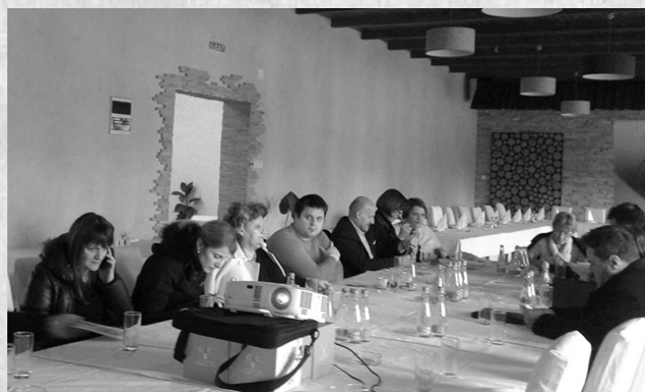
Antikoruptivna radionica za općine

Sredinom februara Udruženje KAM iz Zenice organizivalo je Radionicu za dvije općine koje su kreirale Akcione planove za borbu protiv korupcije kao i one koje trenutno rade na istom dokumentu. Radionica na kojoj su učestvovali Gračanica, Usora, Travnik, Visoko i Žepče, bila je odlična prilika za razmjenu iskustava i dobrih praksi. Na radionici su, osim toga, prezentirani pojedinačni kvantitativni i kvalitativni rezultati nalaza Upitnika o samoprocjeni osjetljivosti na korupciju. Zaključeno je da je potrebno unaprijediti proces izrade budžeta, animirati građane da se aktivnije uključe u javne rasprave, te izraditi dokumente koji će biti razumljiviji građanima.