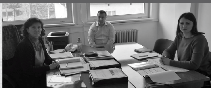
Predstavnici ALDI Goražde i predstavnici Općine Ilijaš na sastanku

U januaru 2018. godine popunjeni su Upitnici o samoprocjeni u Općini Breza i Općini Ilijaš. U skladu sa popunjenim upitnicima, urađene su Kvalitativna uporedna analiza upitnika o samoprocjeni lokalne uprave o antikorupcijskim inicijativama i transparentnosti rada lokalne uprave i Kvantitativna analiza upitnika o samoprocjeni lokalne uprave o antikorupcijskim inicijativama i transparentnosti rada lokalne uprave za Općinu Ilijaš i Općinu Breza.