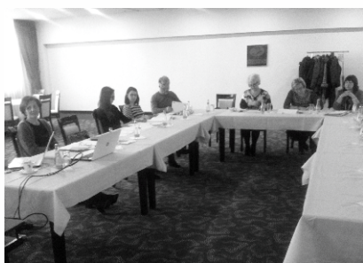
Stručna diskusija - ZDK

Antikorupcijska mreža organizacija civilnog društva u BiH – ACCOUNT u saradnji sa partnerskom organizacijom Inicijativa i civilna akcija (ICVA) i Timom Vlade Zeničko-dobojskog kantona za borbu protiv korupcije, organizovala je stručnu diskusiju za izradu pravilnika za sprečavanje korupcije u javnim zdravstvenim ustanovama u Zeničko-dobojskom kantonu. Diskusiji su prisustvovali predstavnici i koordinatori za borbu protiv korupcije javnih zdravstvenih ustanova u ZDK. Učesnici diskusije su u načelu prihvatili predstavljeni nacrt modela pravilnika, koji će u okviru svojih ustanova prilagoditi unutrašnjoj organizaciji i dodatno prodiskutovati u okviru Tima Vlade ZDK, sa okvirnim rokom do kraja marta 2018. Ova diskusija dio je inicijative za saradnju i zajedničko djelovanje relevantnih institucija, ustanova i organizacija civilnog društva na unapređenju institucionalnog sistema za sprečavanje korupcije u sektoru zdravstva.