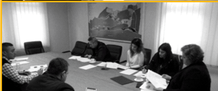
Antikorupciona obuka u Neumu