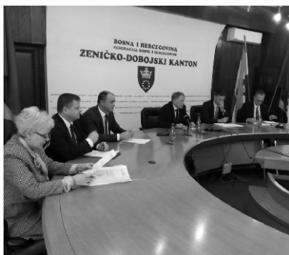
Prezentovana strategija ZDK

U Zeničko-dobojskom kantonu prezentovana je Strategija za borbu protiv korupcije Vlade Zeničko-dobojskog kantona 2017.-2019. Prezentaciji su prisustvovali predstavnici vlasti te predstavnici civilnog društva na čelu sa ACCOUNT-om. Istakli su da ova Strategija ima veliki značaj, a da je poseban napredak ostvario Tim za borbu protiv korupcije. Miralem Galijašević, premijer Zeničko-dobojskog kantona, naglasio je da su obaveze iz usvojene Strategije jedan od prioritarnih ciljeva Vlade, odnosno opredjeljenje svih institucija i ustanova Zeničko-dobojskog kantona u borbi protiv korupcije. Istakao je značaj zajedničkog rada i doprinosa svih subjekata, ali i koordinatora (iz ustanova i institucija na području Kantona), radi uočavanja, praćenja i kontinuiranog provođenja svih planiranih mjera prevencije. Također je naglasio da će Vlada Zeničko-dobojskog kantona staviti na raspolaganje sve stručne i materijalne kapacitete kako bi se ostvarili ciljevi iz Strategije za borbu protiv korupcije i već usvojenog Akcionog plana. Takva opredjeljenja podržala je Agencija za prevenciju korupcije i koordinaciju borbe protiv korupcije BiH ali i Fondacija INFOHOUSE.