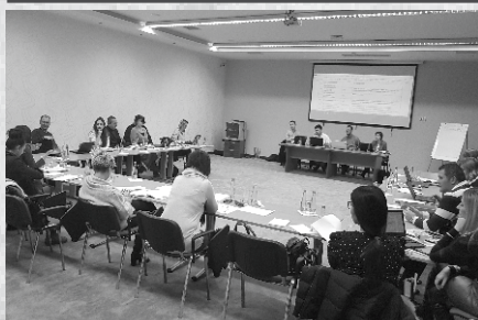
Sastanak sa Radnom grupom u Konjicu, 23-25.januar 2018

Unaprijeđenje Zakona o javnim nabavkama BiH i dalje je u epicentru ACCOUNT pažnje. U saradnji sa partnerskim organizacijama Transparency International, Fond otvoreno društvo i Udruženje Tender definisane su prioritetne oblasti Zakona, čije je unaprijeđenje nužno u cilju uspostavljanja transparentnog i odgovornog sistema javnih nabavki. ACCOUNT je nastavio intenzivnu saradnju sa Agencijom za javne nabavke BiH, te inicirao dijalog sa Radnom grupom Vijeća ministara BiH koja vodi aktuelni proces izmjena i dopuna Zakona o javnim nabavkama. O ACCOUNT prijedlozima za unaprijeđenje zakonskog okvira diskutovano je na trodnevnom skupu Radne grupe, koji je održan u Konjicu, od 23-25. januara 2018. godine. Zagovaračkim aktivnostima ACCOUNT Sektorske grupe "javne nabavke", čiji je cilj unaprijeđenje legislative i sistema javnih nabavki, koordinira Udruženje CRMA.