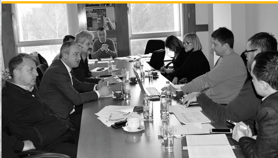
Sastanak sa PAK-om Narodne skupštine RS, Banja Luka, 5. februar 2018.

Predstavnici ACCOUNT-a (CRMA) prisustvovali su sjednici Poslaničkog antikorupcijskog kluba (PAK) Narodne skupštine Republike Srpske, koja je održana 05. februara 2018.g. u Banja Luci. Razgovarano je o realizaciji Strategije za borbu protiv korupcije RS (2013-2017), nacrtu Strategije za period 2018-2022, planu aktivnosti PAK-a u narednom periodu. Sjednica je bila prilika i za razmjenu iskustava, te detaljnije upoznavanje članova PAK-a sa ACCOUNT aktivnostima.