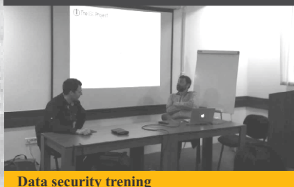
Data security trening

Udruženje CRMA, koje koordinira aktivnostima ACCOUNT medijske komponente, organizovalo je trening za medije i novinare na temu digitalne bezbjednosti. Obuka "Digital Security Awareness", namijenjena članicama ACCOUNT Media pool realizovana je u saradnji sa projektom "Information, Safety, Capacity"(ISC). Bezbjednija komunikacija, društvene mreže i digitalna bezbjednost, sigurnost mobilnih podataka – ključne su teme o kojima je bilo riječi na treningu, koji je održan 10. januara 2018. u Banja Luci.